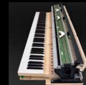
Mechanische Prinzipien wie bei einem Flügel – hierzu gehören auch Holzasten in voller Größe, die eine exklusive Haptik vermitteln

Die Bewegungen des Künstlers verwandeln sich in Musik. Bei der Umsetzung von Bewegung in Klang spielen viele Faktoren eine Rolle, wobei die Tastenbeschaffenheit besonders wichtig ist. Bereits bei der ersten Berührung lässt sich das absolut authentische Spielgefühl am CELVIANO Grand Hybrid erahnen. Die revolutionäre Grand Hammer Action-Tastatur verfügt über echte Holzasten in voller Größe. Zum neuentwickelten Tastaturmechanismus gehören Hämmer, die in ihren Bewegungsbahnen identisch mit denen eines Konzertflügels sind. Wenn der Deckel angehoben ist, kann man die Hämmer beim Spielen in ihrer Bewegung verfolgen. Durch die Weiterentwicklung einer herkömmlichen Flügelmechanik ist eine schnellere Repetition möglich, wobei das echte Tastengefühl bewahrt wird.