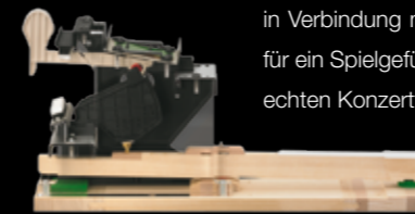
Der neu entwickelte Hammermechanismus von CASIO entspricht der Hammerbewegung eines akustischen Konzertflügels

Um den Tastenanschlag realitätsgetreu wiederzugeben, hat CASIO die Flügelmechanik genau analysiert. Das Ergebnis ist ein neuentwickelter Mechanismus, gebaut nach denselben Prinzipien wie bei einem Konzertflügel: Wenn eine Taste gedrückt wird, hebt sich ein echter Hammer. Das Ergebnis der präzisen Analyse des Spielwerks in Verbindung mit der Echtholzastatur sorgt für ein Spielgefühl, wie man es nur von einem echten Konzertflügel kennt.