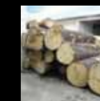
Hochwertiges österreichisches Fichtenholz, wie es für die Tasten eines C. Bechstein Flügels verwendet wird

Die Materialien und die Herstellungsverfahren der Tastatur sind die gleichen, die traditionell für Flügel verwendet werden. Hochwertiges Holz wurde sorgfältig ausgewählt, getrocknet und bearbeitet. Das Finish der Tasten hat dieselben Eigenschaften wie das der akustischen Flügelasten. Die vertraute Haptik trägt wesentlich zum Spielkomfort des Musikers bei.