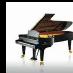
Das Meisterstück C. Bechstein D282 – Einer der Flügel, der von CASIO für die Klangent- wicklung analysiert wurde

Das CELVIANO Grand Hybrid gibt die feinsten Nuancen der weltweit berühmtesten Konzertflügel wieder. Für dieses ambitionierte Projekt wurden drei Flügel ausgewählt, die ihre Wurzeln in Berlin, Hamburg und Wien haben. CASIO hat die einzigartigen Klangeigenschaften der jeweiligen Instrumente erforscht und sorgfältig nachgebildet. Das CELVIANO Grand Hybrid kann dank der Spitzentechnologie von CASIO den individuellen Klang der namhaften Instrumente originalgetreu wiedergeben.